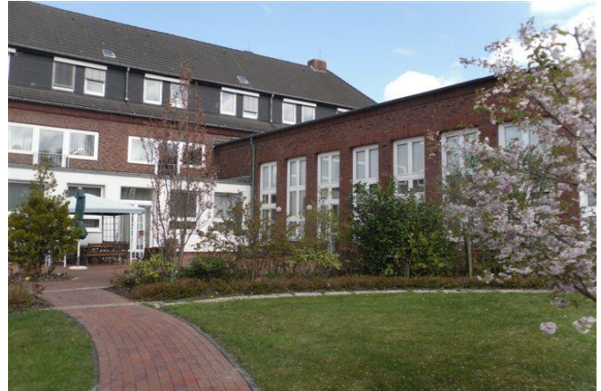
Garten / Terrasse

Es steht ein Gemeinschaftsraum für gemeinsame Mahlzeiten, Gespräche, Gymnastik und Spielnachmittage zur Verfügung.